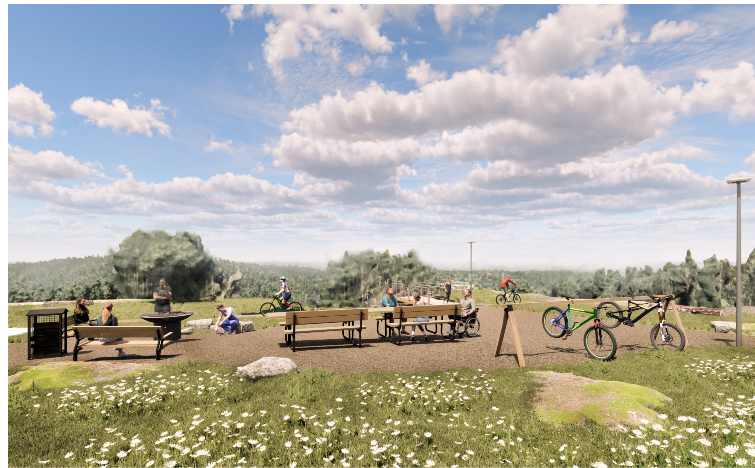
Näkymä huipulta kohti pohjoista, edustalla näköala- ja grillipaikka.