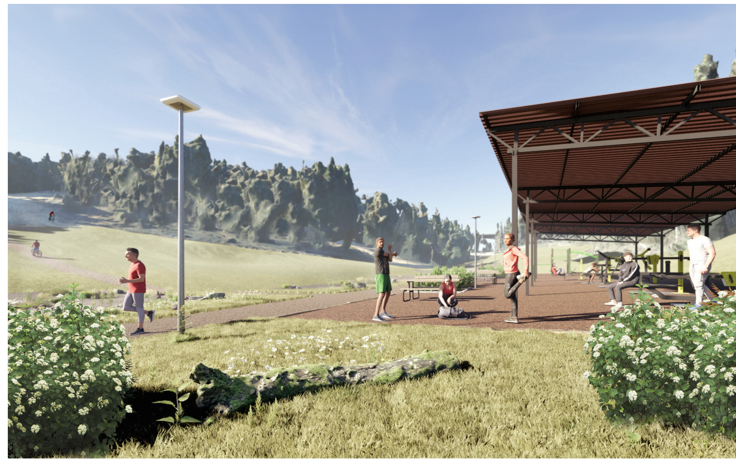
Näkymä "kanjonista" kohti länttä, oikealla ulkokuntosali.